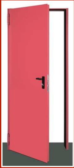
Tek Kanat Yangın Kapısı ve Kasası

NINZ Yangın Kapıları standart olarak 60-120-180 dakika yangına dayabilecek alternatiflerde üretilmektedir. Yangın kapıları kendi kasa sistemi ile birlikte sunulmaktadır