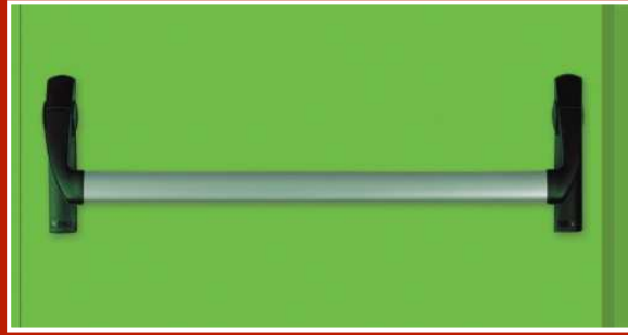
Panik Bar – Panik Çıkış Kilidi

NINZ Yangın Kapıları standart olarak 60-120-180 dakika yangına dayabilecek alternatiflerde üretilmektedir. Yangın kapıları kendi kasa sistemi ile birlikte sunulmaktadır