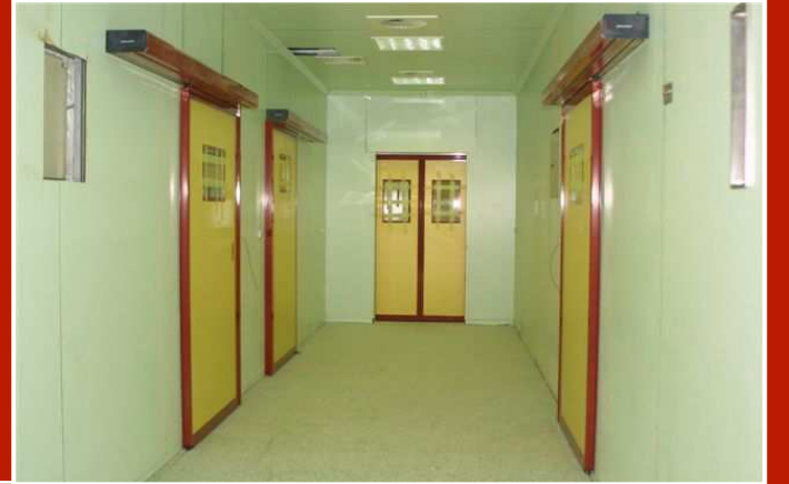
İki Hareketli Kanatlı Şifreli ve Pencereli Yarı Hermetik Kapılar

Yarı Hermetik Kapılar özel tasarlanmış alüminyum profiller içerisine monte edilen 18mm MDF LAM malzeme ile imal edilmektedir. Hareketli kanat üzerine çift camdan oluşan 300mm x 500mm veya kabul edilebilir özel ölçü taleplerinde gözetleme penceresi yerleştirilmektedir. Kapı alt etek kısmına fırça, kanatların birleştiği profile ise EPDM kauçuk fitil monte edilerek sızdırmazlık sağlanmaktadır.