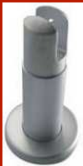
Ayak - Paslanmaz