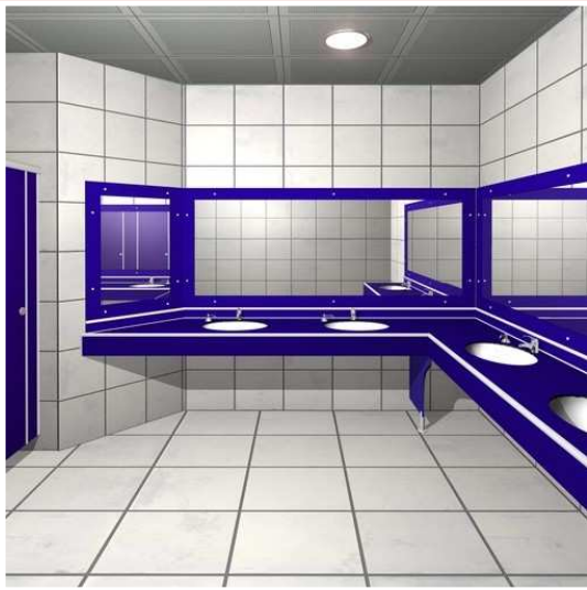
Proline " L " Tezgah