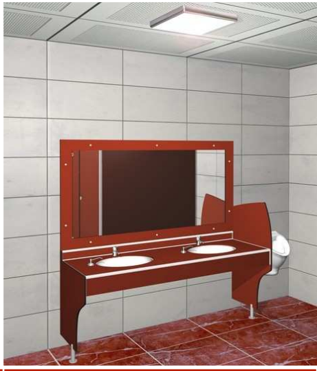
Proline Tezgah 2'li