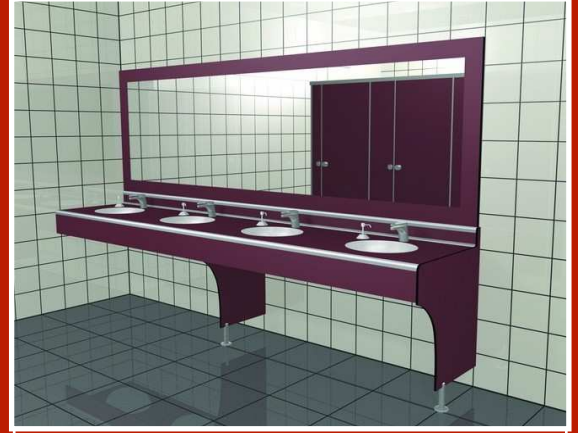
Proline Tezgah 4'lü