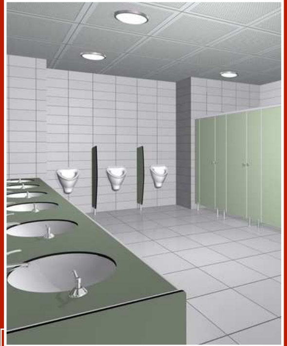
Proline Tezgah 4'lü